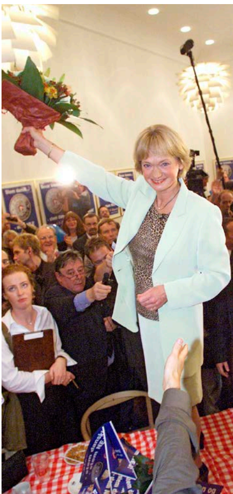
Pia Kjærsgaard og DF fejrer i 2000, at danskerne sagde nej til at udskifte kronen med euroen. Billedet med Pia blev forside på udenlandske aviser.

I 1986 stemte hun også ja til EF-pakken om det indre marked, men derfra blev Pia Kjærsgaard mere og mere kritisk, og i 1992, da hun var politisk leder for Fremskridtspartiet, kæmpede hun for et nej ved