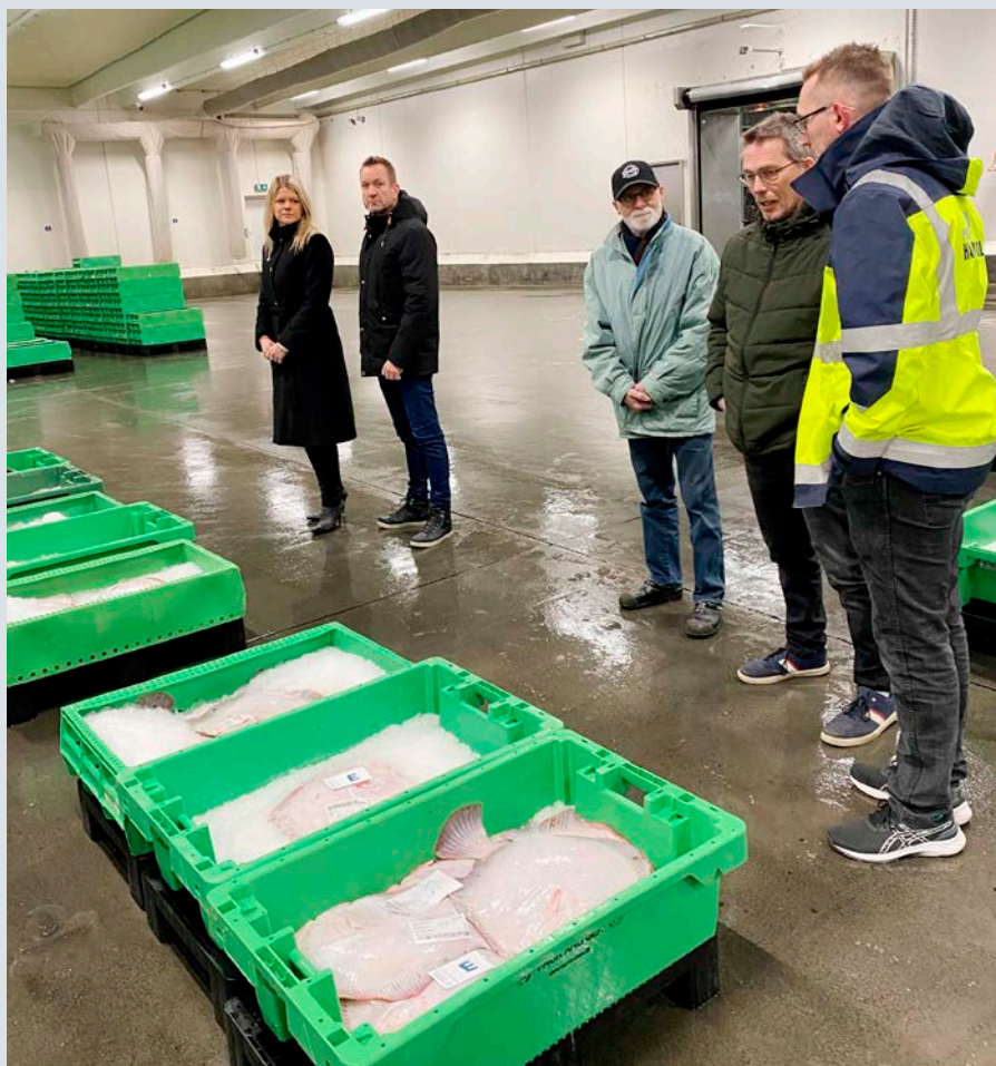
Fredag morgen startede på fiskeriauktionen i Hanstholm.