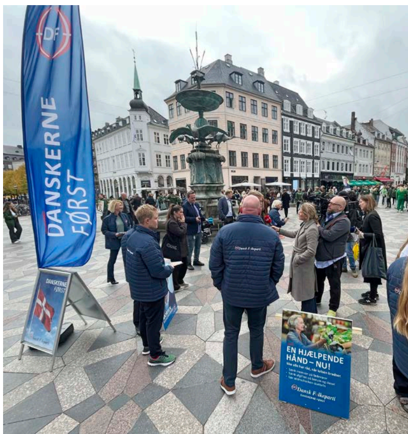
DF tager hul på valgkampen til folketingsvalget i 2022.

SÅ MANGE MILLIONER KRONER HAR ODENSE KOMMUNE BRUGT PÅ BLOT OTTE KRIMINELLE INDVANDRER-FAMILIER DE SIDSTE 15 ÅR.