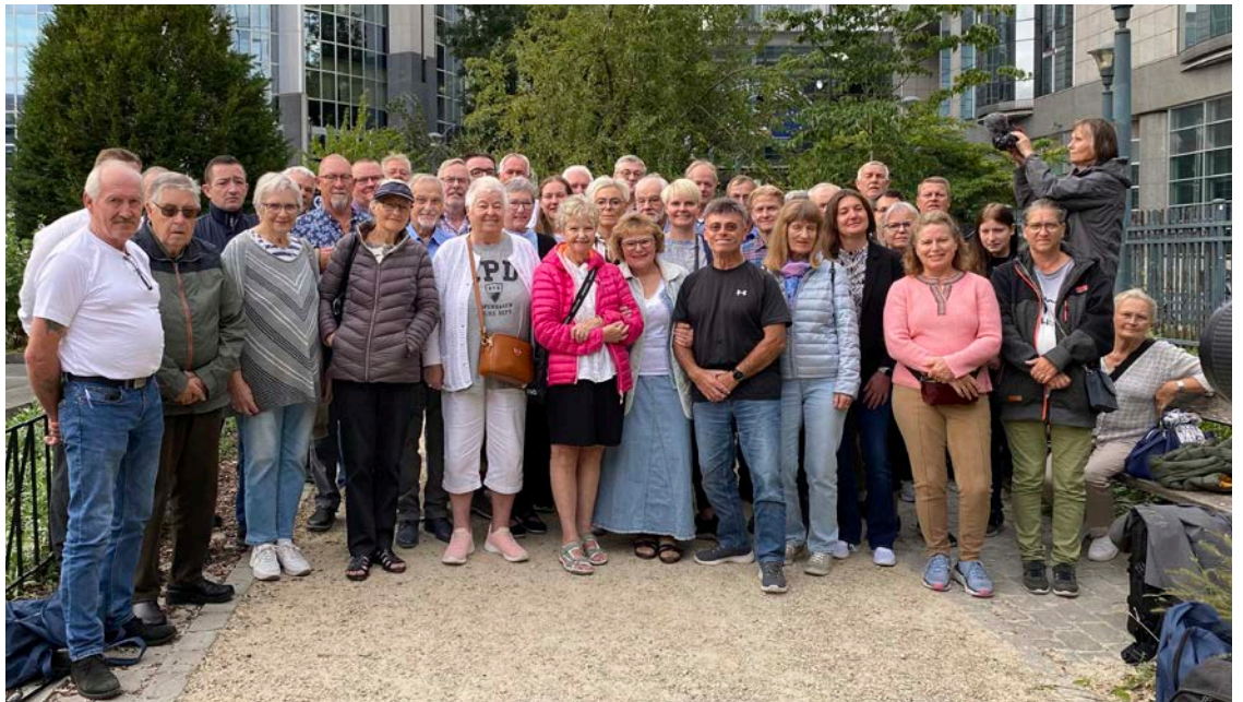
DF-holdet der i september havde fire intensive dage i Bruxelles.

”Trods det trætte vejr var vores sind fyldt med erfaringer og erkendelser fra turen. På vej hjem reflekterede vi over de forskelle i regler og praksis mellem EU-landene, og spørgsmålet om ens regler inden for EU blev rejst. Med en fyldestgørende rejse bag os og en dybere forståelse af EU's komplekse struktur og udfordringer vender vi tilbage til Danmark, klar til at fortsætte kampen for vores nationale interesser og suverænitet”.