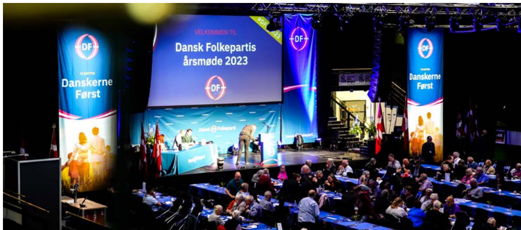
De nye priser skal uddeles på DFs årsmøde.