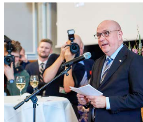
Folketingets formand Søren Gade taler.