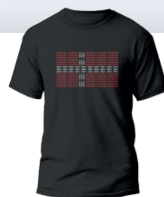
DANNEBROG T-SHIRT 149 KR.