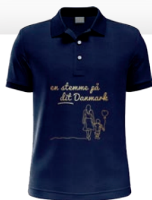
BLÅ POLO 279 KR.