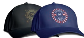
DF KASKETTER 139 KR. PR. STK.