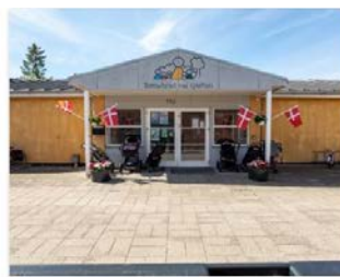
Børnehave aflyser krænkende indianerfest

Der er mænd. Der er kvinder. Ikke sandt? Jo. Men det er ikke det, som især