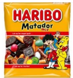
Så døde matadoren i Matador Mix

Et barn, der er klædt ud som en indianer – det går virkelig ikke! I hvert fald var en