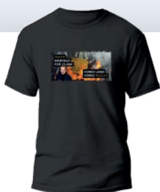
MÅNEDENS T-SHIRT 149 KR.