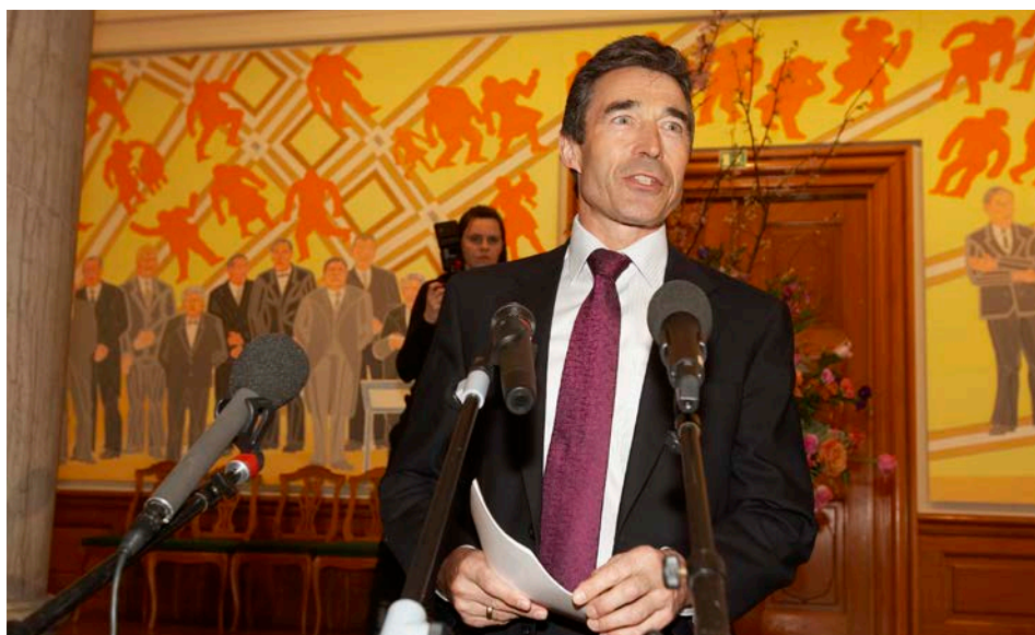
Anders Fogh Rasmussen tog på 60-års dagen for ophøret af samarbejdspolitikken et frontalopgør med tilpasningsivrige og underdanige politikere.