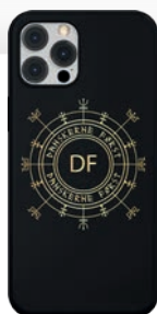
VIKING MOBILCOVER 109 KR.