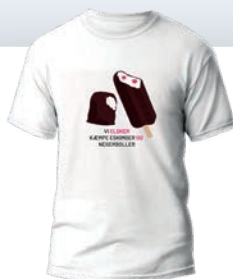
VI ELSKER... T-SHIRT 149 KR.