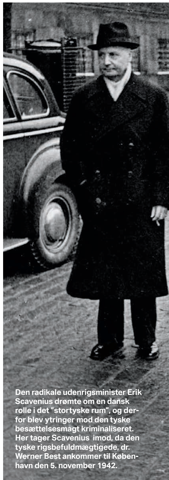
Den radikale udenrigsminister Erik Scavenius drømte om en dansk rolle i det "stortyske rum", og derfor blev ytringer mod den tyske besættelsesmagt kriminaliseret. Her tager Scavenius imod, da den tyske rigsbefuldmægtigede, dr. Werner Best ankommer til København den 5. november 1942.

statsministeren, at hans kritik af samarbejdspolitikken tre år tidligere ikke bare var tomme ord. Trods massive krav om en undskyldning for de satiriske tegninger, og trods utallige bange ryster fra størrelser som mejerivirksomheden Arla og pumpeproducenten Grundfos.