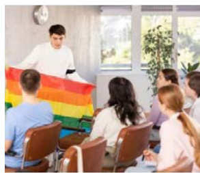
Børn undervises i, at der er 65 køn

I Holland er der bevilget aktiv døds-hjælp til en ung mand, som lod sig kastre i et forsøg på at blive transkønnet. "Jeg var jo blot homoseksuel, ikke transseksuel" siger han. /kofoed